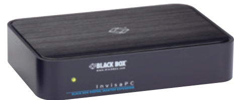
DTX1000-T – INVISAPC-SENDER