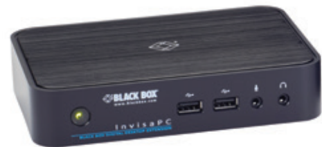
DTX1000-R – INVISAPC-EMPFÄNGER